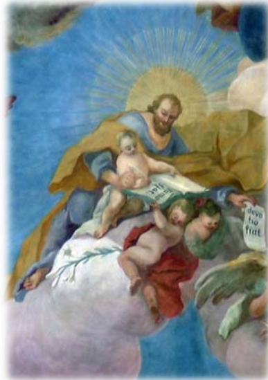
Detail aus dem Deckenfresko der Pfarrkirche St. Martin

Alle Gläubigen sind ganz herzlich zur Mitfeier eingeladen!