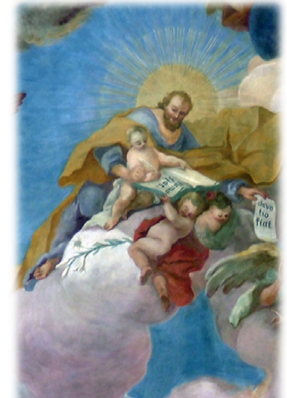
Detail aus dem Deckenfresko der Pfarrkirche St. Martin

Alle Gläubigen sind ganz herzlich zur Mitfeier eingeladen!